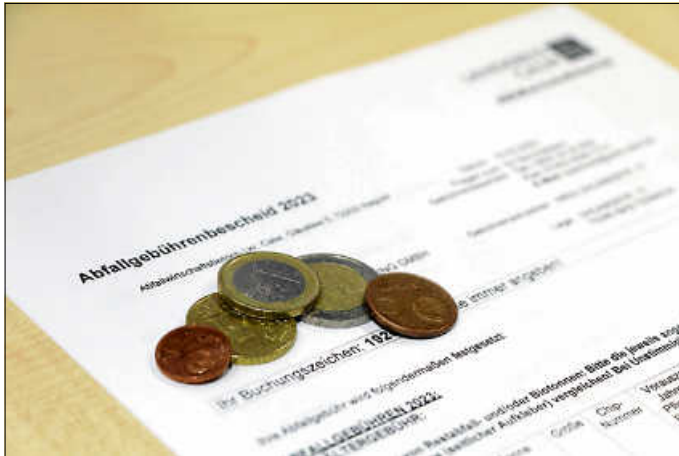
Abfallgebührenbescheide 2023 werden verschickt

Nagold. Ende Februar werden im Landkreis Calw die Abfallgebührenbescheide 2023 verschickt. Die Abfallberatung hat aus diesem Grund in den Tagen nach dem Versand ihre telefonischen Servicezeiten deutlich erweitert.