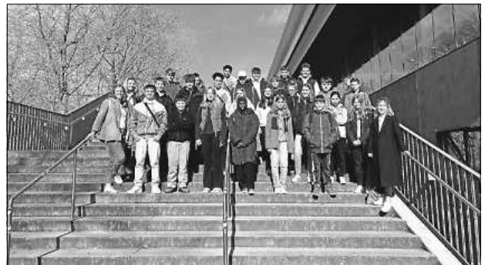
Die „Profulfach-Sport-Schüler“ der Klassen 8-10

Gestartet sind wir gemeinsam um 08:30 Uhr in Herrenberg. Mit der S-Bahn in Stuttgart angekommen, liefen wir gemeinsam bei strahlendem Wetter Richtung Porsche-Arena. Vor der Halle machten wir gemeinsam ein Gruppenfoto, bevor wir uns an den Einlasskontrollen anstellten. In der Halle erwarteten uns viele Werbepartner, die tolle Angebote und Mitmachaktionen für uns vorbereitet hatten, bis wir schließlich unsere Plätze aufgesucht hatten und die Meisterschaft losging.