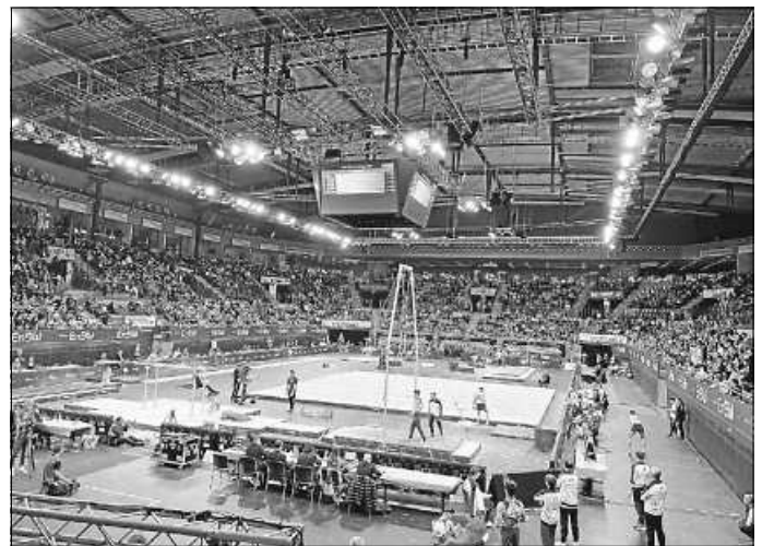
EnBW DTB-Pokal 2023 in der Stuttgarter Porsche-Arena

Am Freitag, den 17.03.2023 besuchten die Profulfach-Sport-Klassen 8-10 den 38. EnBW DTB-Pokal 2023 in der Stuttgarter Porsche-Arena, wobei die weltbesten männlichen Jung-Turner angetreten sind. Dabei waren 11 Länder.