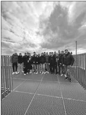
Gruppenfoto der Klasse 10

Am Montag, den 03.04. ging es für uns 10. Klässler als kleine Verschnaufpause nach den ersten mündlichen und praktischen Prüfungen einen Tag nach Stuttgart. Gemeinsam starteten wir um 08:30 Uhr am Bahnhof in Herrenberg und von dort aus fuhren wir mit der S-Bahn nach Stuttgart.