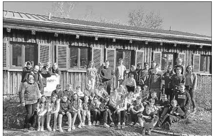
Die Klassen 6a und 6b