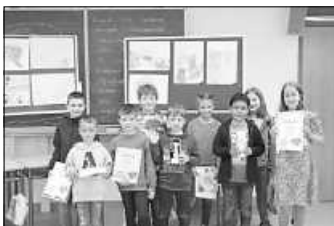
Die Gewinner der Lindenrain-Schule

Auch in diesem Schuljahr nahmen die Grundschulklassen 2a, 3b, 3a, 4a und 4b der Lindenrain-Schule am Jugendwettbewerb der Volksbanken Raiffeisenbanken teil.