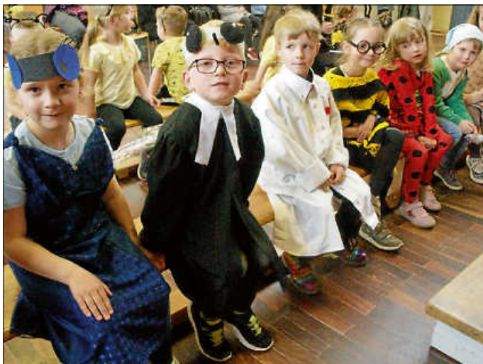
Die kleinen Schauspieler warten auf den großen Auftritt

Aktuell werden 80 Kinder im Alter von einem bis sieben Jahren in der Tulpenstraße betreut. Diese 80 Kinder mit ihren zwölf Erzieherinnen, ihren Familien, mit Gästen aus der Nachbarschaft und Ehrengästen feierten am 13.05 ein schönes buntes und fröhliches Jubiläumfest.