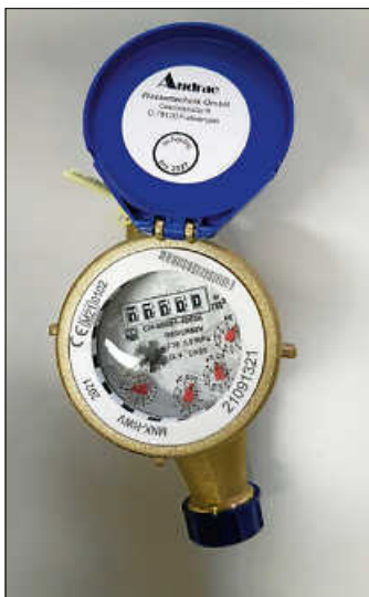
Wasserzähler 2021

In den nächsten Tagen werden die Anschreiben mit der angehängten Abrisskarte für die Selbstablesung der Wasseruhren wieder zugestellt.