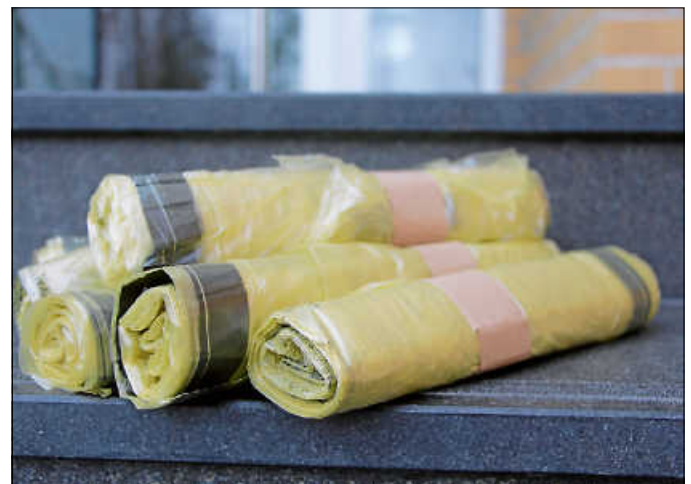
Im Kreis Calw werden wieder Gelbe Säcke verteilt.

Die Verteilung im gesamten Landkreis erfolgt bis Weihnachten. Sie wird immer an den Tagen durchgeführt, an denen das nächste Mal die Gelben Säcke abgeholt und die Gelben Tonnen geleert werden. Die Termine können dem Abfallkalender entnommen werden. Die Gelben Säcke werden neben den Briefkästen oder am Hauseingang abgelegt. Die Nutzer Gelber Tonnen werden gebeten, diese an den Leerungstagen erst abends wieder zurückzustellen. Nur so ist für die Verteiler ersichtlich, wo tatsächlich Gelbe Säcke benötigt werden. Sollte bei der Austeilung versehentlich ein Haushalt oder Gewerbebetrieb vergessen werden, kann dies REMONDIS unter der Telefonnummer 0800 12 23 255 oder der E-Mail-Adresse: nl.freudenstadt@remondis.de gemeldet werden.