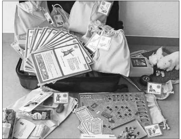
Neue Themenkoffer für Grundschulen und Kindergärten

Die Themenkoffer können kostenlos bei der Abfallwirtschaft ausgeliehen werden. Interessierte Kindergärten und Schulen finden weitere Informationen unter www.awg-info.de oder können sich unter der Telefonnummer 07452 6006 70 74 oder per E-Mail an kontakt@awg-info.de bei der AWG melden.