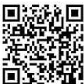
QR-Code Meine Umwelt-App

Der Landkreis Calw bittet die Bevölkerung um Aufmerksamkeit und verantwortungsbewusstes Handeln. Durch sachgerechte Meldung bei der LUBW und professionelle Entfernung durch fachkundige Personen kann die weitere Ausbreitung der Asiatischen Hornisse bestmöglich begleitet und kontrolliert werden.