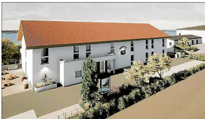
Das Entwicklungsprogramm Ländlicher Raum (ELR) förderte den Neubau des Landhotels „Motel 394“ in Oberreichenbach.