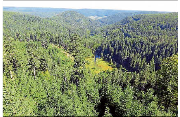
Die LEADER-Region Nordschwarzwald – eine der waldreichsten LEADER-Regionen in Deutschland

Die Ergebnisse der Untersuchung sowie weitere Informationen zu LEADER im Nordschwarzwald gibt es unter www.leader-nordschwarzwald.de .