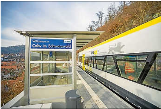
Kostenfreie Fahrt im VVS für Inhaberinnen und Inhaber der Ehrenamtskarte am Samstag, den 23. Mai 2026

Der Landkreis Calw bedankt sich herzlich bei allen ehrenamtlich Engagierten für ihren wertvollen Einsatz und ihr Engagement für die Gesellschaft.