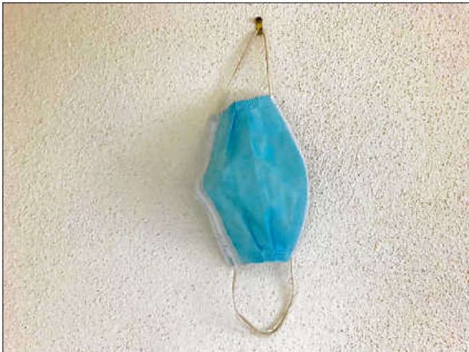
Gebrauchte medizinische Schutzmasken und FFP2-Masken gehören in die Restabfalltonne.

Bei Fragen zur Entsorgung von Masken und sonstigen Haushaltsabfällen während der aktuellen Corona-Pandemie, gibt die Abfallberatung der AWG unter der kostenlosen Servicenummer 0800 30 30 839 oder der E-Mail-Adresse abfallberatung@awg-info.de gerne Auskunft. Allgemeine Informationen rund um das Thema Abfall können auch im Internet über www.awg-info.de eingeholt werden.