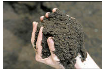
Qualitätsgesicherter Gütekompost

Naturpark-Blumenwiesenerde in Nagold und Simmozheim Ab sofort gibt es wieder gütegesicherter Qualitätskompost auf allen Recyclinghöfen des Landkreises. Zudem ist auf den Höfen Simmozheim und Nagold auch wieder Naturpark-Blumenwiesenerde im Angebot.