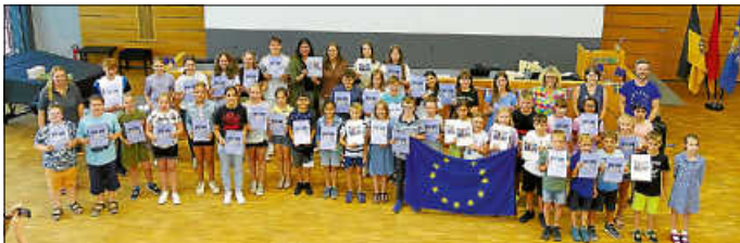
Zahlreiche Schülerinnen und Schüler durften ihre Urkunden und Preise im Landratsamt Calw entgegennehmen.

Weitergehende Informationen rund um den Europäischen Wettbewerb finden sich unter Europäischer Wettbewerb I (europaeischerwettbewerb.de) und Europäischer Wettbewerb › Europa Zentrum (europa-zentrum.de).