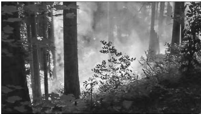
Waldbrand in Bad Teinach-Zavelstein