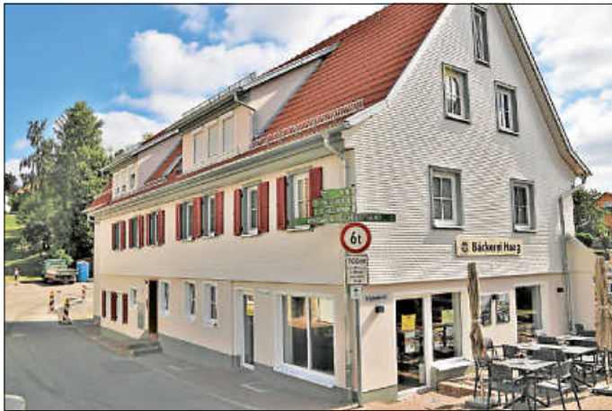
Das neugestaltete Bohnenberger Haus in Zavelstein ist ein Vorzeigeprojekt für Wohnen und Grundversorgung in der Ortsmitte

Die für die Antragstellung notwendigen Formulare sind unter der Internetadresse https://rp.baden.wuerttemberg.de/themen/land/elr abzurufen.