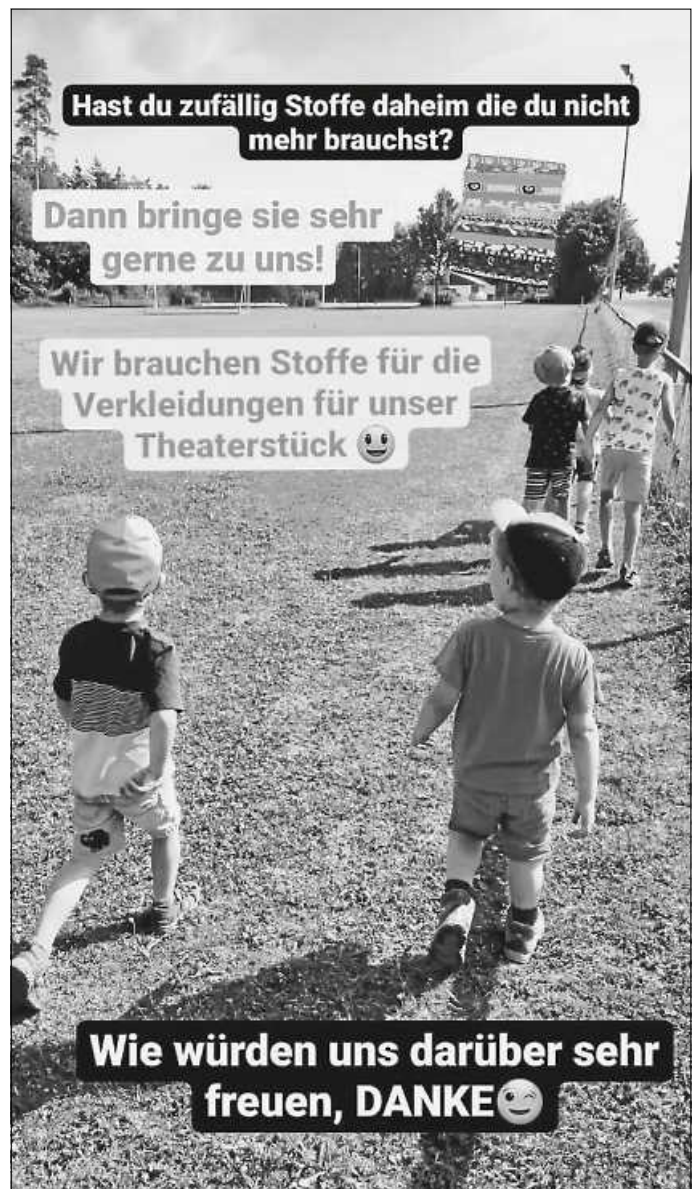
Plakat: Die Waldwichtel

Vielen Dank schon mal im Voraus. Liebe Grüße! Die Waldwichtel