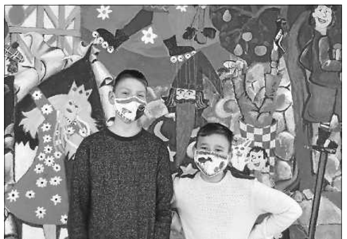
Stolze Gewinner des Maskenwettbewerbs