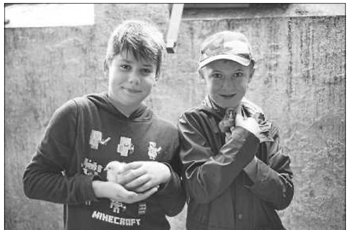
Streicheln der frisch gebrüteten Küken