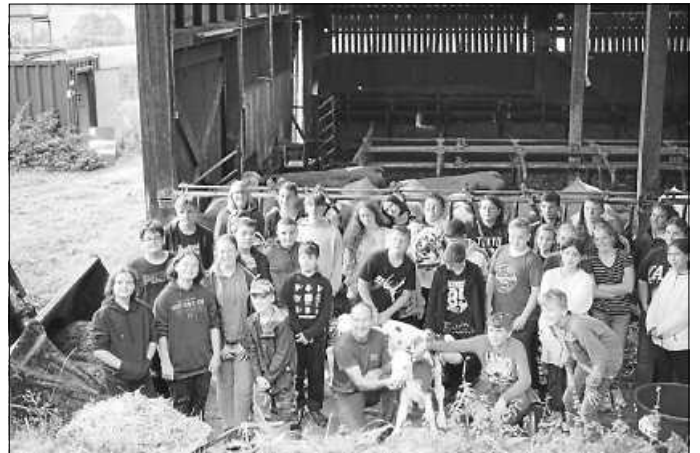
Die Siebtklässler/innen auf dem Kepplerhof

Auf dem Kepplerhof hatte die Familie Keppler ein tolles Programm für die Schülerinnen und Schüler vorbereitet: Am Vormittag bekamen die Jugendlichen Einblicke in das Kuhmelken mit Melkrobotern, durften selbst Kälbchen mit der Milch von Mutterkühen füttern und schließlich noch Esel und Hühner und deren frisch gebrütete Küken streicheln. Nach einer Vesperpause und Zeit zur freien Verfügung, die die meisten Schülerinnen und Schüler auf der Strohhurg verbrachten, wurde am Nachmittag in anschaulichen Theorieeinheiten thematisiert, welche Produkte aus Milch hergestellt werden können. Daran anschließend durften die Siebtklässler/innen Butter aus Sahne bzw. Käse und Joghurt selbst herstellen. „Alle Schülerinnen und Schüler haben den Ausflug genossen. Einige Jugendliche brachten bereits viel Vorwissen mit, trotzdem war die Verbindung von Tradition und Fortschritt auf dem Kepplerhof für viele sehr beeindruckend“, berichtete Tutzauer. Nicht zuletzt sei der Ausflug auch für die Klassengemeinschaft sehr bereichernd gewesen, da in den letzten beiden Schuljahren coronabedingt fast keine außerschulischen Aktivitäten stattfinden konnten. Alles in allem waren also nicht nur der Wettbewerb, sondern auch der Ausflug nach Freudenstadt ein voller Erfolg und ein tolles Erlebnis für die Jugendlichen.