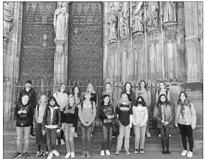
Vor dem Straßburger Münster

Die Lindenrain-Schule legt im Bereich der Fremdsprachen besonderen Wert auf Angebote außerhalb des regulären Unterrichts, die zur Förderung der interkulturellen Kompetenz sowie des Spracherwerbs der Schülerinnen und Schüler beitragen. Aus diesem Grund ist es besonders schön, dass nun trotz Pandemie, eintägige außerschulische Aktivitäten wieder stattfinden können.