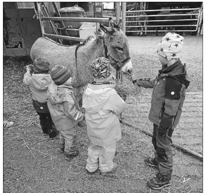
Die Waldwichtel und Esel Elif