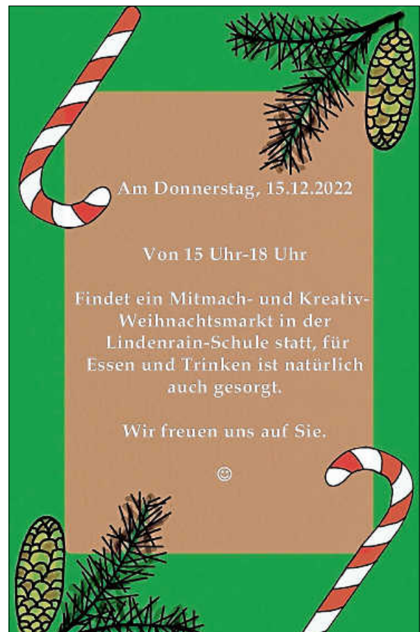
Plakat: K. Schill