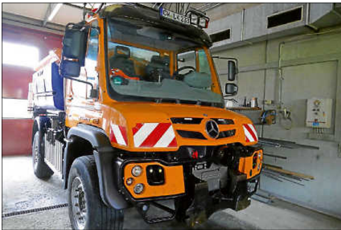
Insgesamt zehn Räumfahrzeuge der Straßenmeistereien sorgen im Winter für Verkehrssicherheit auf den Straßen im Kreis Calw.

So wie die Betriebsdienste müssen sich auch alle Verkehrsteilnehmerinnen und -teilnehmer auf den Winter einstellen, bekräftigt der Abteilungsleiter: „Nutzen Sie Winterreifen und passen Sie Ihre Fahrweise an die Straßenverhältnisse an, damit Sie sicher an Ihr Ziel kommen. Besonders bei uns im Nordschwarzwald mit seinen Kurven und Gefällstrecken ist im Winter eine erhöhte Aufmerksamkeit nötig. Besondere Vorsicht ist auch auf Brücken und schattigen Waldstrecken geboten.“