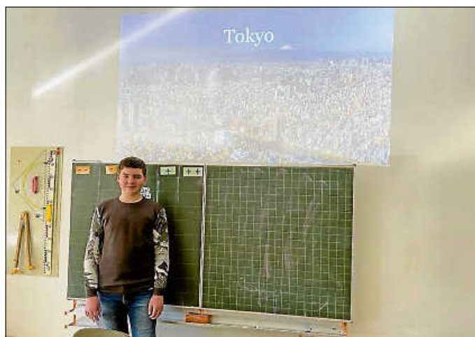
Kommunikationsprüfung im Fach Englisch