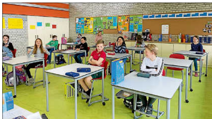
Viertklässler im Präsenzunterricht