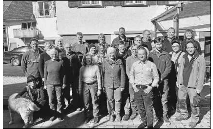
Die neuen Obst- und Gartenfachwarte im Landkreis Calw.

Insbesondere die fehlende Pflege der Obstbäume sowie die Überalterung der Streuobstbestände sind eine wesentliche Gefährdung für unsere Streuobstwiesen. Obstbäume benötigen einen regelmäßigen Pflegeschnitt, um nicht vorzeitig zu vergehen. Nur dann können die Bäume ein hohes Baumalter erreichen und durch die Ausbildung von wertvollen Habitatstrukturen wie Höhlen und Totholz einen wichtigen Lebensraum für Fledermäuse und andere Arten bieten.