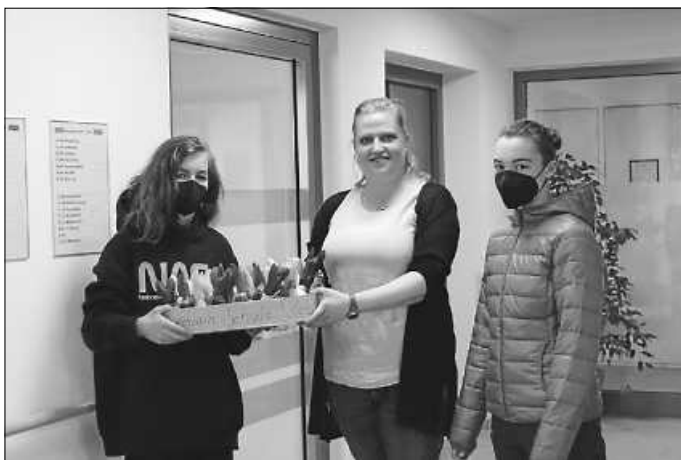
Schüler der Lindenrain-Schule übergeben die Ostergrüße.