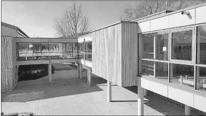
Der bereits fertige Neubau