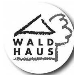
Logo: Waldhaus gGmbH

Wie immer gilt: Scheuen Sie sich nicht uns anzusprechen, gemeinsam mit Ihnen suchen wir nach den passenden Lösungen für Sie; in der Einzelfallberatung unterliegt das Jugendreferat der gesetzlichen Schweigepflicht! Die aktuelle Situation stellt alle vor ganz besondere Herausforderungen, Familien sind durch die Umstände ganz besonders belastet.