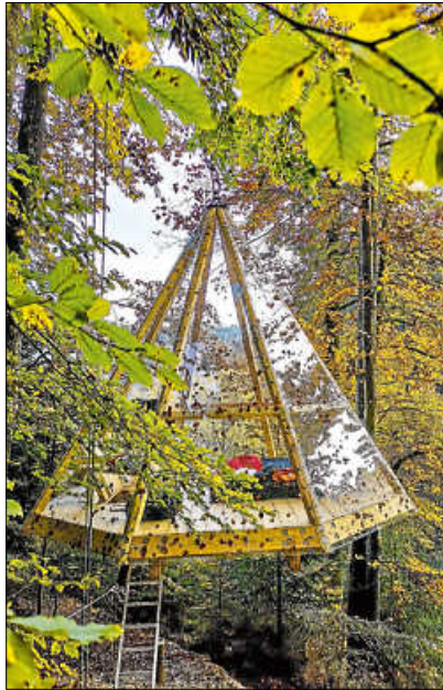
Das Baumhaus in Bad Teinach Zavelstein ist eines der geförderten Kleinprojekte.

Die mit der Geschäftsstelle der LEADER-Aktionsgruppe Nordschwarzwald abgestimmten und vorgeprüften Anträge müssen bis spätestens bis 10. Juni 2024 eingereicht werden. Deshalb soll-