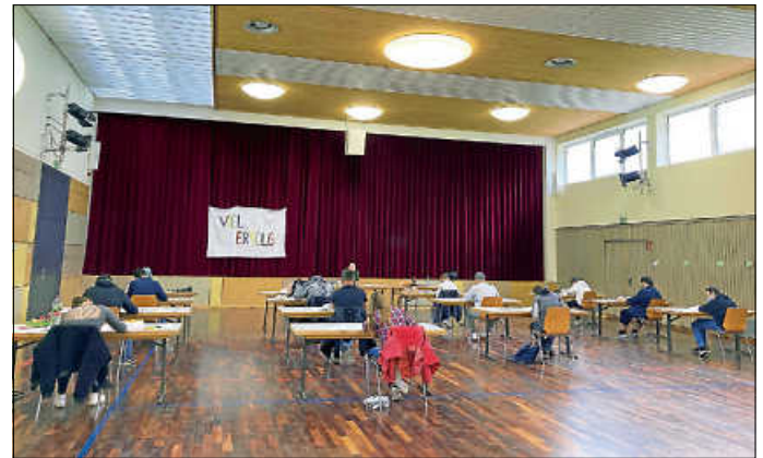
Abschlussprüfungen der Zehntklässler