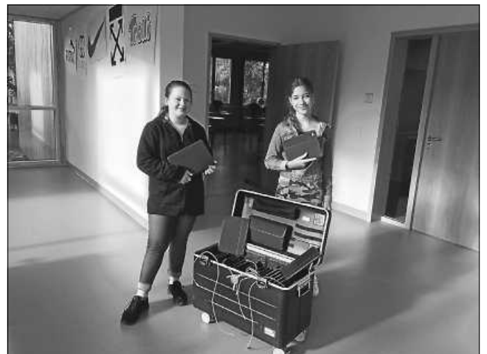
Schülerinnen der Klasse 6 mit den Schüler-iPads

Für nächstes Schuljahr wurde außerdem der Ausbau des WLANs in der Außenstelle in Rotfelden beschlossen, die Anschaffung von 20 iPads und von Präsentationseinheiten für die neuen Klassenzimmer in der Außenstelle.