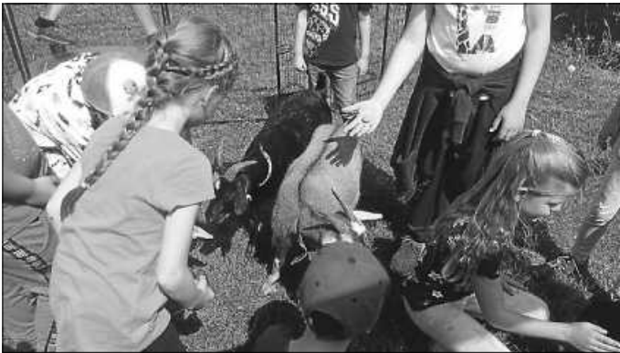
Bei den Ziegen