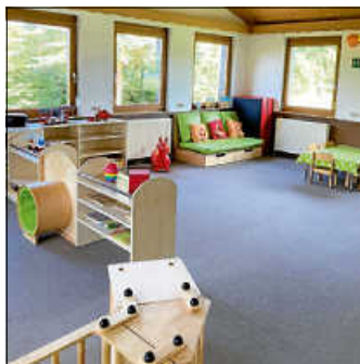
Gruppenraum U3 Glühwürmchen

Es ist so weit! Wir sind mit all unserem Inventar ins Sportheim umgezogen. Viele Gedanken haben wir uns gemacht, einige Vorbereitungen waren nötig – doch nun ist es geschafft und wir freuen uns, euch nach den Sommerferien, am 9. September 2024, in unseren „neuen“ Räumen im Sportheim begrüßen zu dürfen!