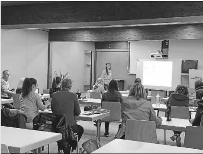
Das Grundschulteam bei der Fortbildung zu Microsoft 365