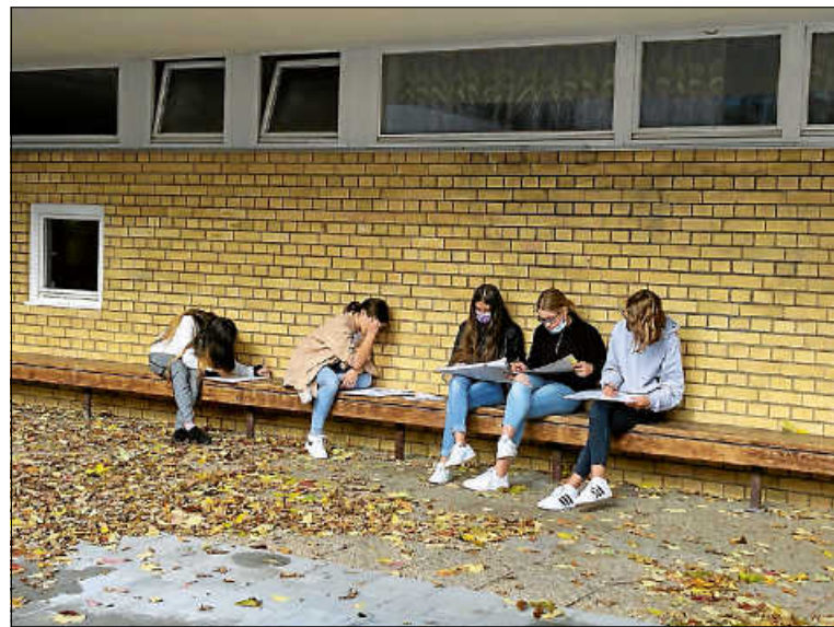
Schülerinnen arbeiten an ihrer Zeichnung