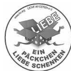
Logo: Licht im Osten e.V.