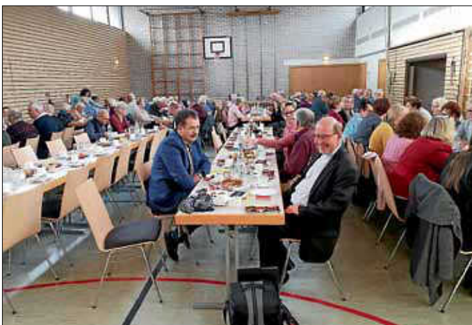
Seniorenachmittag in Rotfelden für Rotfelden und Wenden