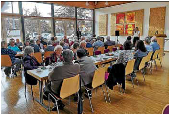
Seniorenachmittag in Ebershardt für Ebershardt