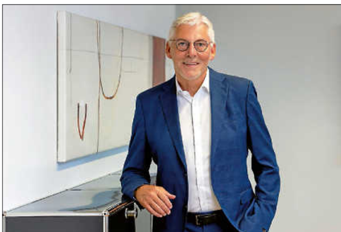
Landrat Helmut Riegger