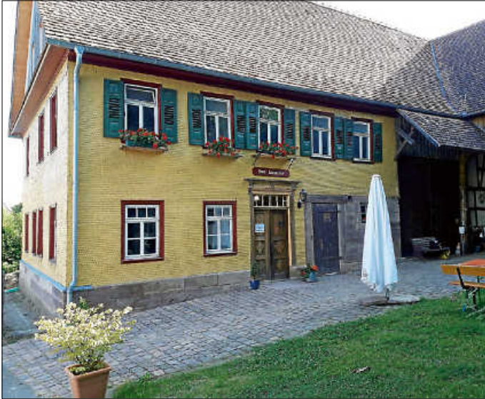
Das Entwicklungsprogramm Ländlicher Raum unterstützt lebendige Ortskerne sowie die Umnutzung und Reaktivierung alter Bausubstanz zu bspw. Dorfkneipen: Hier der Lausbua in Wildberg-Effringen.